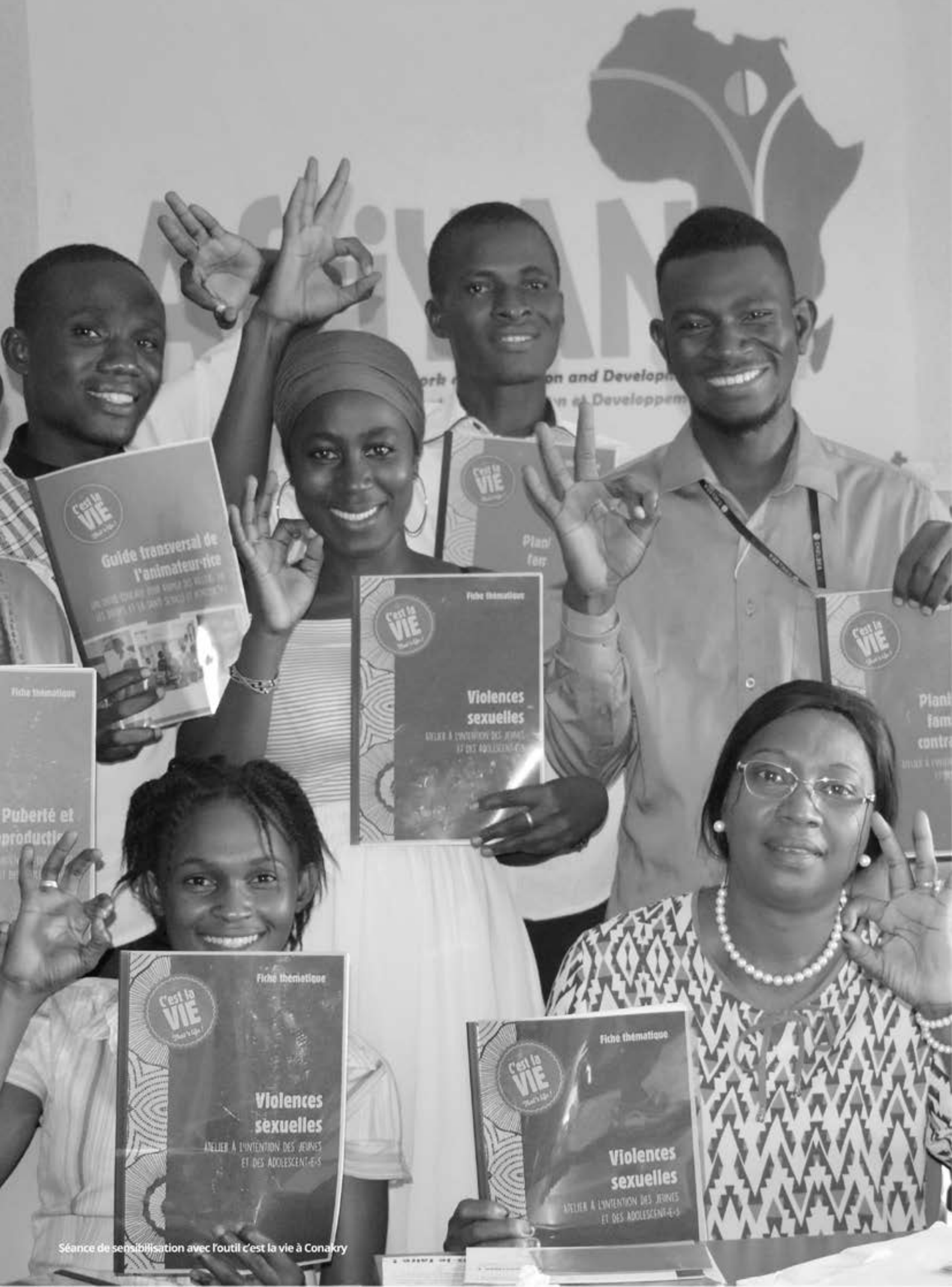
Séance de sensibilisation avec l'outil c'est la vie à Conakry