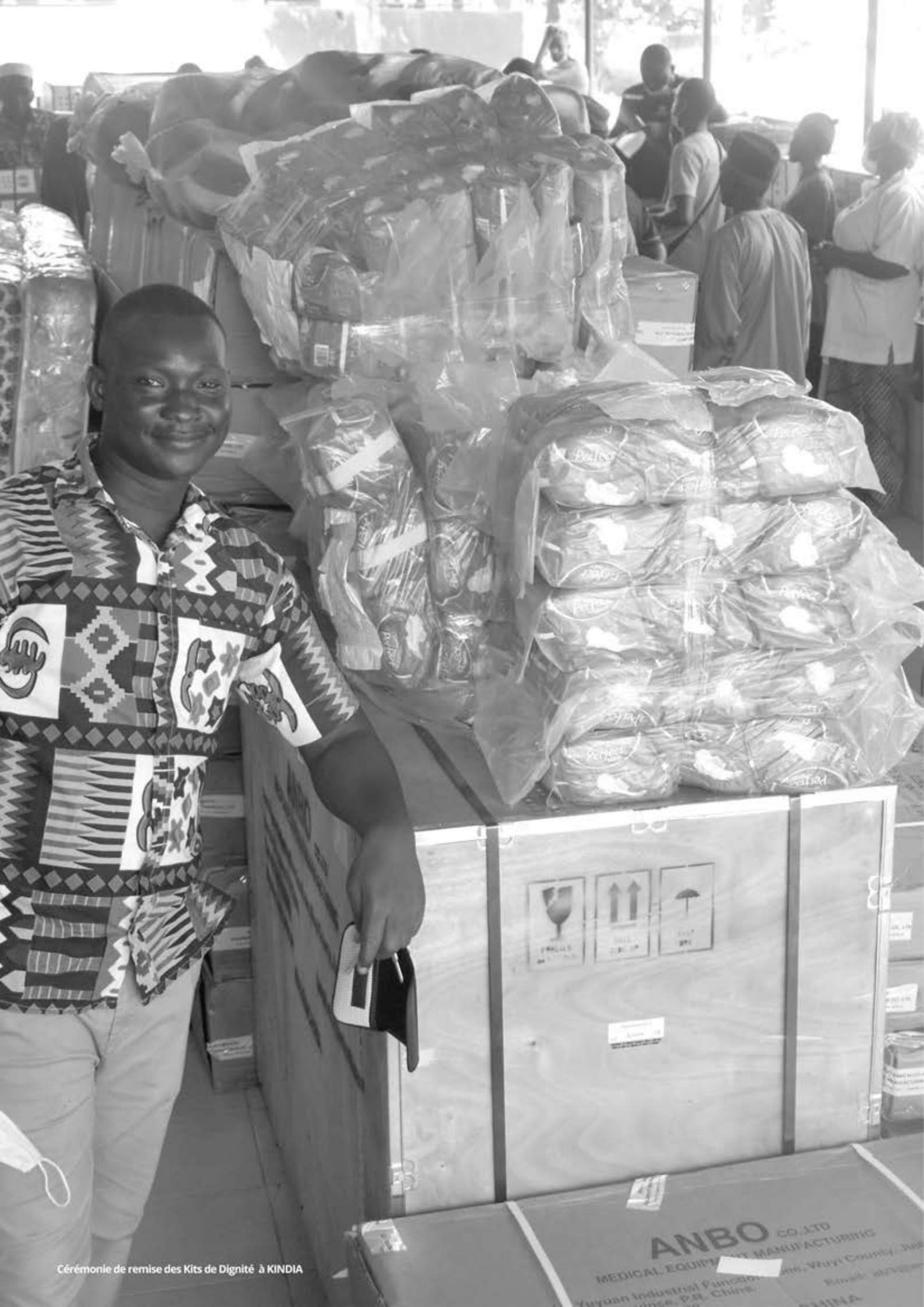
Cérémonie de remise des Kits de Dignité à KINDIA

ANBO CO., LTD MEDICAL EQUIPMENT MANUFACTURING Yuyuan Industrial Functional Zone, Wuyi County, Jiangsu Province, P.R. China. Email: anbo@anbo.com CHINA