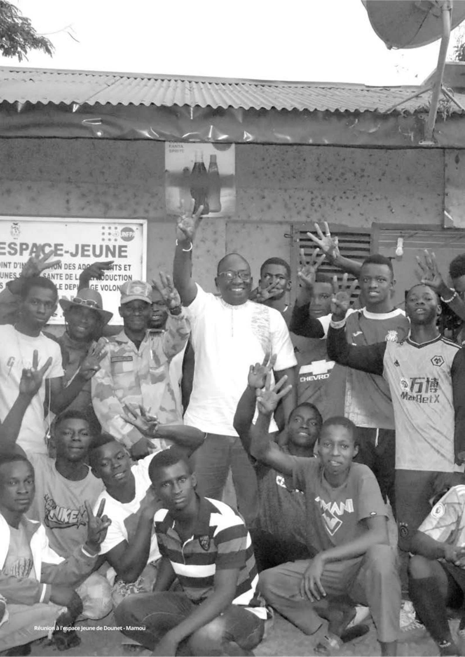
Réunion à l'espace Jeune de Dounet - Mamou