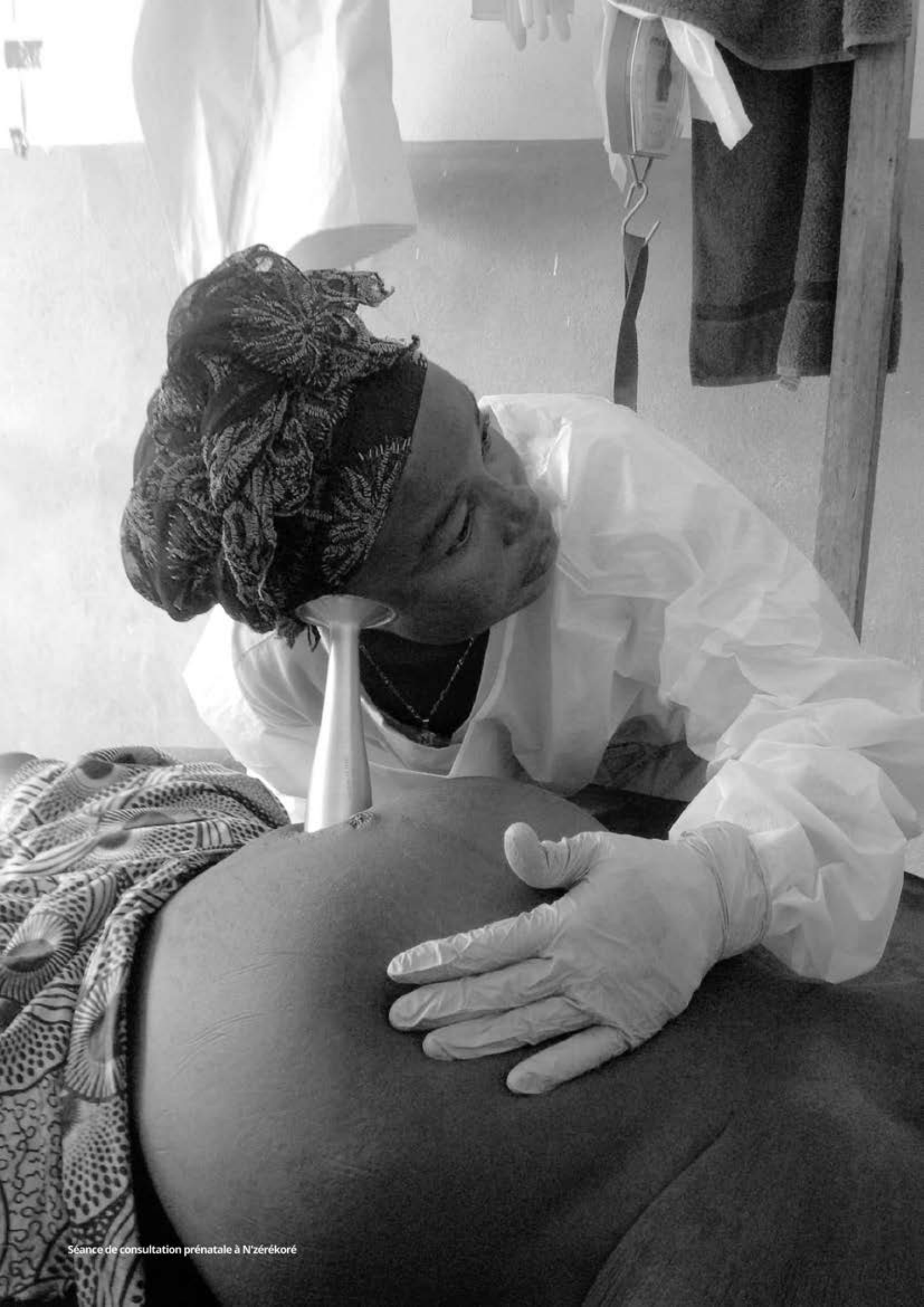
Séance de consultation prénatale à N'zérékoré